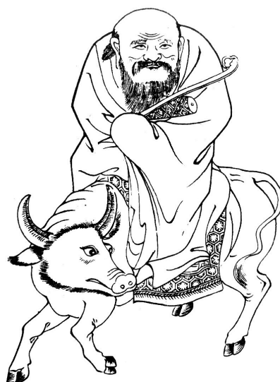
图 1 老子

山野蛮人在他最近所谓的游记“阿拉斯加” [2] 之结尾中写到：“大至天地万物，细如芸芸众生，究其宗者，在圣人老聃看来本质上也不过是一条短短的四阶积分链：“人法地，地法天，天法道”，始于道、终于人。而主宰这条积分链的控制系统也颇为简单，即老子所说的“道法自然”，一个全信息反馈的控制器。所谓的“大道至简”！”本文尝试揭示老子这宇宙定律与全状态反馈控制系统的关系。